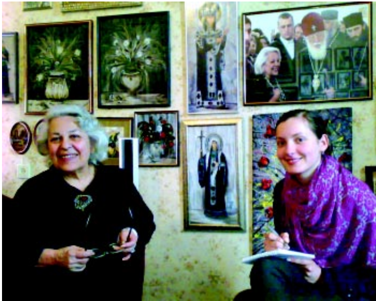
ყველაფერი „თავისით იხატება“. ამ სილამაზის ავტორი საოცრად კეთილი და სათნოა. სადაც წავიკითხე: „სიყვარული მარადი-